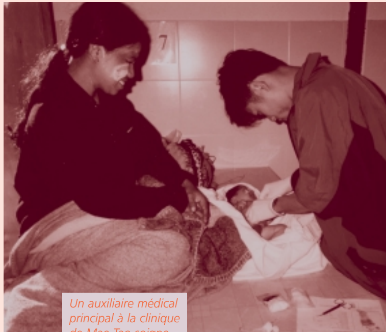
Un auxiliaire médical principal à la clinique de Mae Tao soigne un nouveau-né.

le Jonathan Mann Health and Human Rights Award, le John Humphries Award et le prestigieux Magsaysay Award, pour les qualités de compassion et de courage qui se dégagent de ses efforts à remédier aux problèmes de santé et de droits humains auxquels sont confrontés les Birmans de souche en Thaïlande et les personnes déplacées au Myanmar.